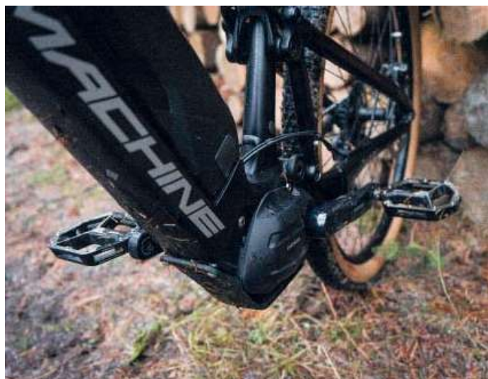
Kabeláž vede vnitřkem rámu a pokračuje dozadu.