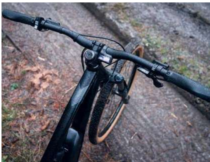
Přehledný kokpit a vše na svém místě.