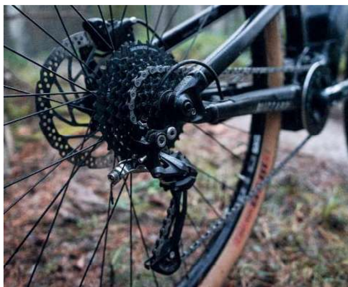
Devět rychlostí pro sportovní jízdu stačí.