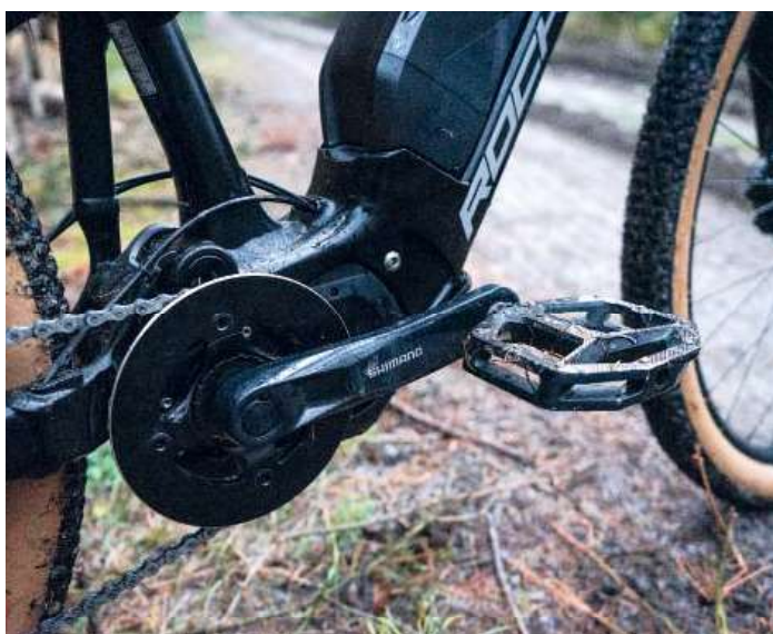
Jednoduchý převodník s krytem řetězu.